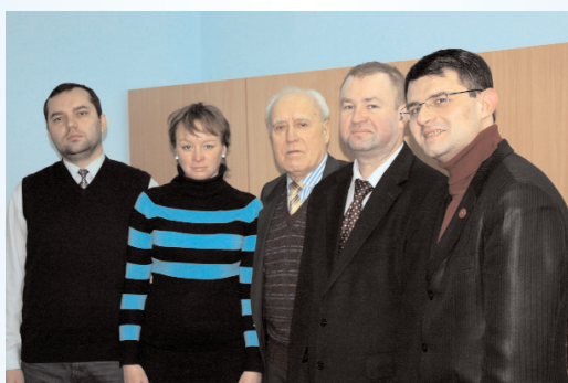
Колектив кафедри правознавства